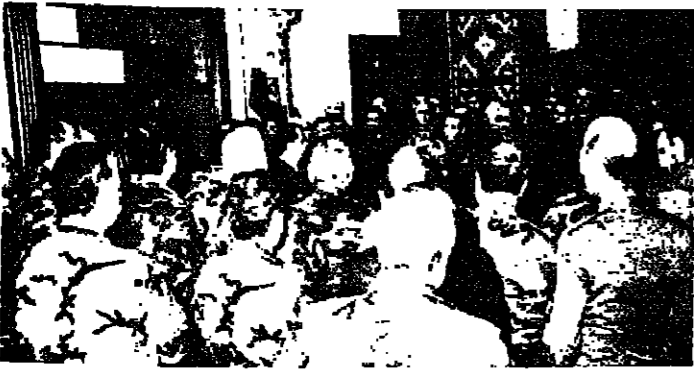
العماد عون يستقبل كبار ضباط الجيش (الاراضي ونيرا)